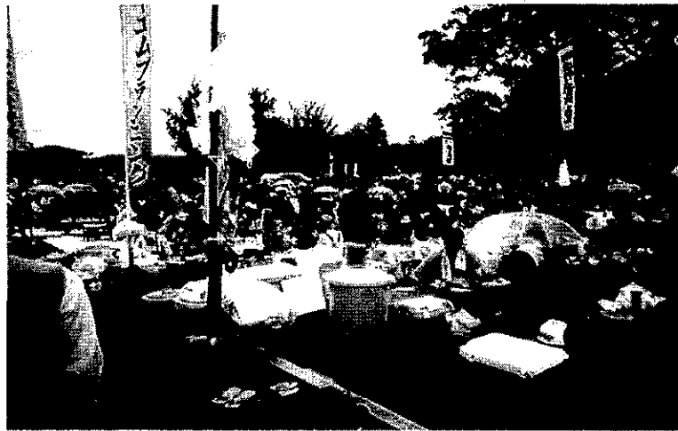
ร่วมงานเทศกาลริวเซ (Ryusei Matsuri) เทศกาลบั้งไฟโนแบบญี่ปุ่นที่เมืองชิชิบุ