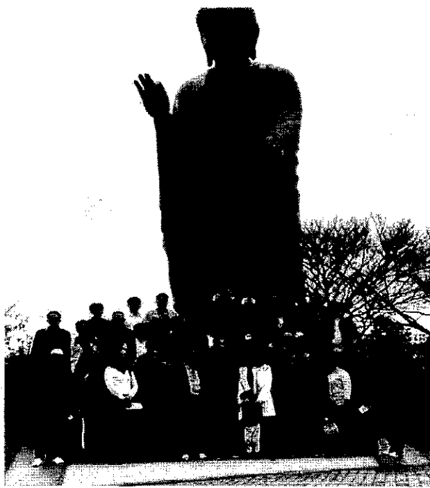
พระพุทธรูป Ushiku Daibutsu พระพุทธรูปปางยืนที่หล่อจากทองสัมฤทธิ์ที่สูงที่สุดในโลก เมืองอิราบากิ