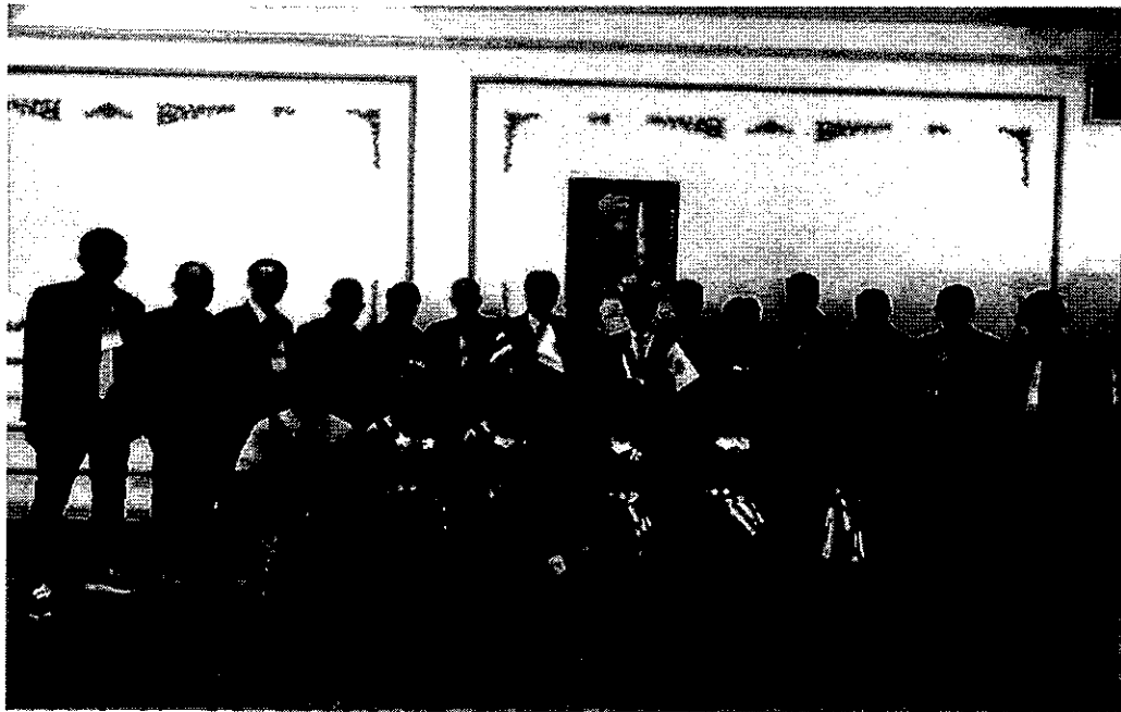
ร่วมงานเฉลิมฉลองครบรอบ ๒๕ ปี สืบสานความสัมพันธ์แลกเปลี่ยนมิตรภาพ ระหว่างเทศบาลบึงไฟและเทศบาล Ryusei Matsusi