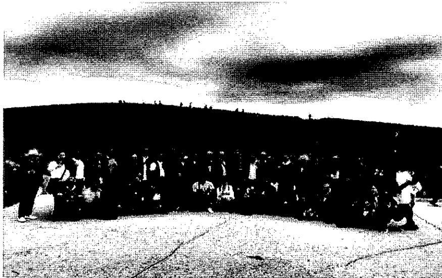
สวนดอกไม้ อิตาลี ซีไรซ์ ปาร์ค เมืองอิราบากิ สวนดอกไม้ริมทะเลขนาดใหญ่