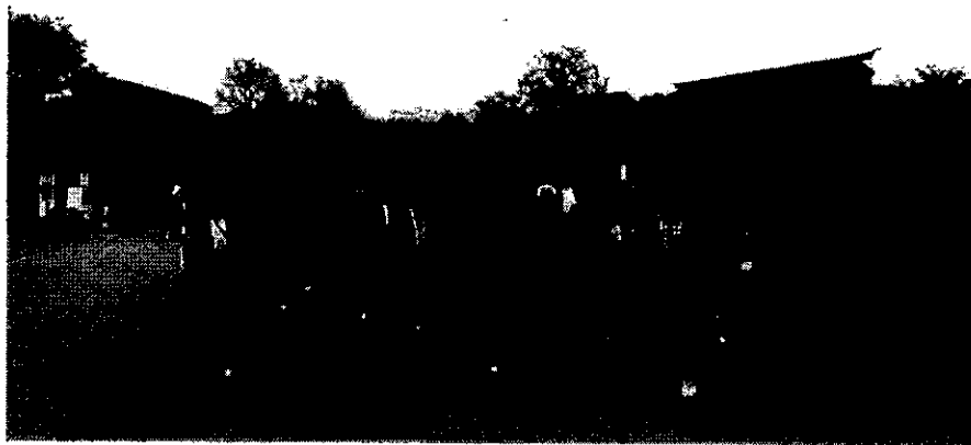
หมู่บ้านโซชิโนะ อักโก เิงภูเขาไฟฟูจิ จังหวัดยามานาชิ หรือหมู่บ้านน้ำใส ได้รับการขึ้นทะเบียนเป็นมรดกทางธรรมชาติ